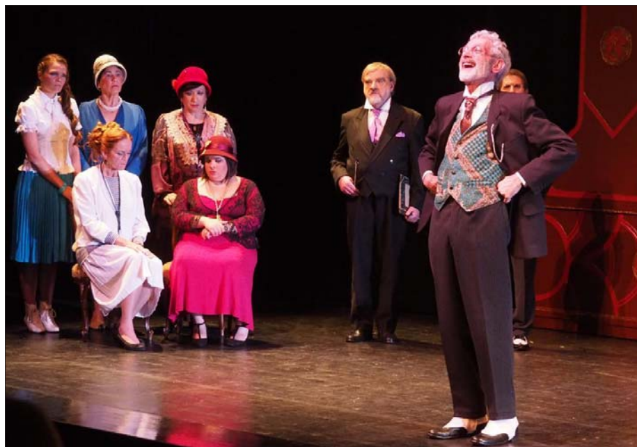
Dernière occasion pour voir « C'est ainsi (si bon vous semble) » au théâtre La Coupole.

La Compagnie du Lys monte sur les planches, au théâtre La Coupole à Saint-Louis, pour la dernière de « C'est ainsi (si bon vous semble) », de Pirandello.