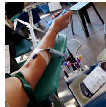
Collecte de sang aujourd'hui, de 16 h 30 à 19 h 30, à Koetzingue.