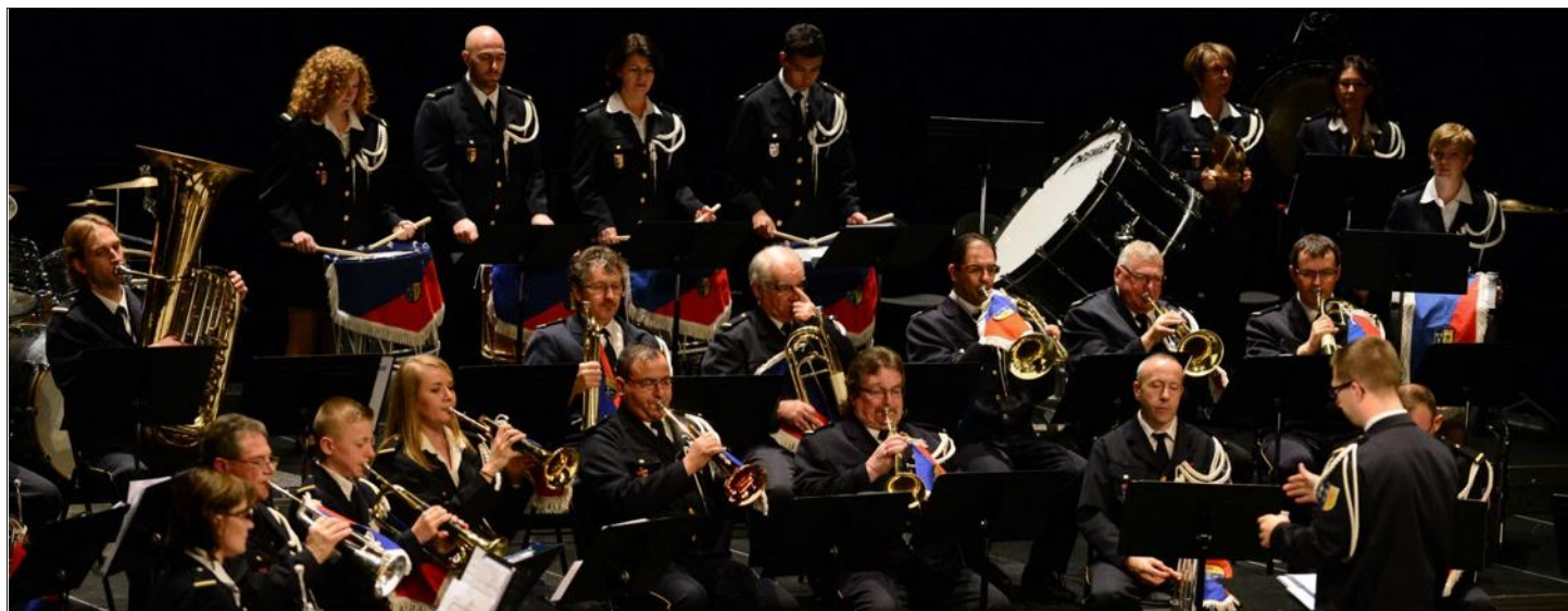
La Batterie-fanfane de Bourgfelden se produira à La Coupole les 12 et 13 novembre.

Dans le cadre du centenaire de la guerre de 14-18, la Batterie-fanfane de Bourgfelden se lance dans un projet théâtral, « Frères soldats », qui sera joué en novembre prochain, en collaboration avec la Compagnie du Lys.